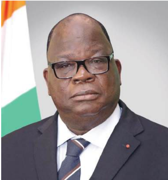
M. Laurent TCHAGBA Ministre des Eaux et Forêts

A l'entame de cette nouvelle année 2025, je voudrais formuler pour vous, vos familles et tous ceux qui vous sont chers, mes vœux les meilleurs.