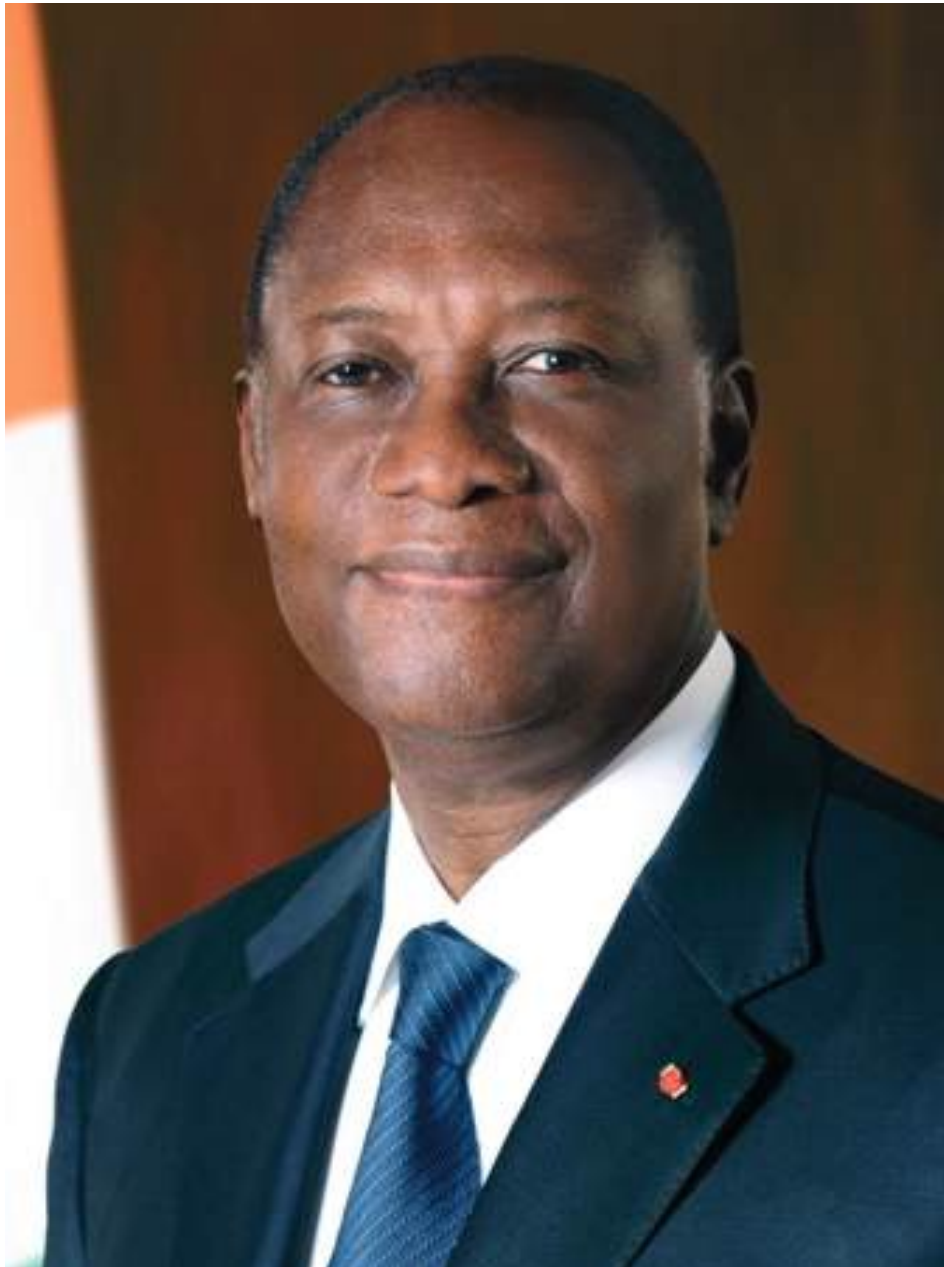
SEM Alassane OUATTARA Président de la République de Côte d'Ivoire

République de Côte d'Ivoire Union - Discipline - Travail